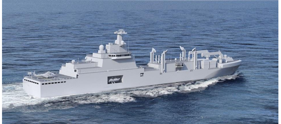
Vue 3 D du futur Bâtiment Ravitailleur de Force